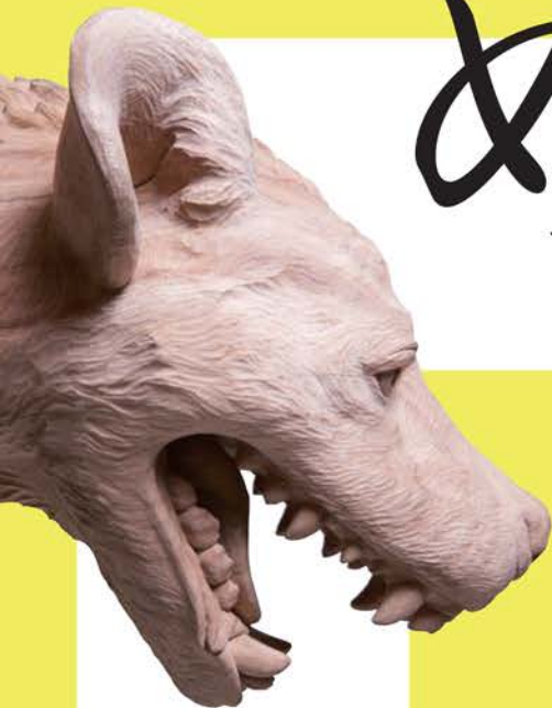
池島康輔《死肉貪獣》2014 WATARU YONEDA