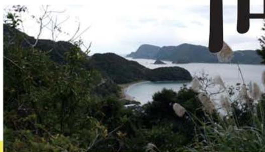
渡辺真也《哀史奄美》2017