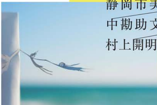
千葉広一《風はいつでも吹いていた》2013