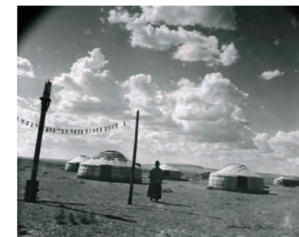
5. 内蒙古 阿巴嘎(アバガ)大王府