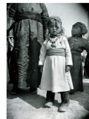
4. 内蒙古 貝子廟