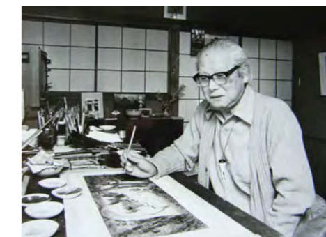
9. 赤羽末吉 自宅アトリエにて 1983年