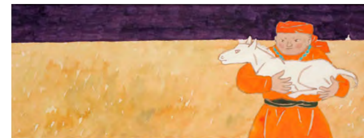
1. 赤羽末吉《スーホの白い馬》表紙 1967年 ちひろ美術館