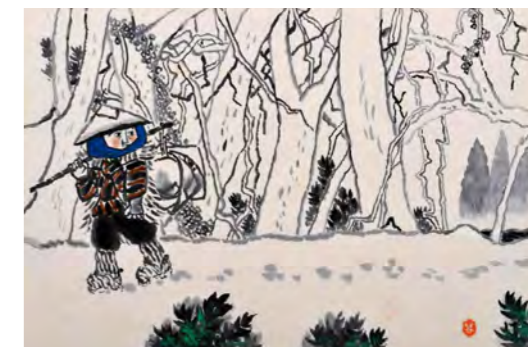
6. 赤羽末吉《かさじぞう》表紙 1960年 ちひろ美術館