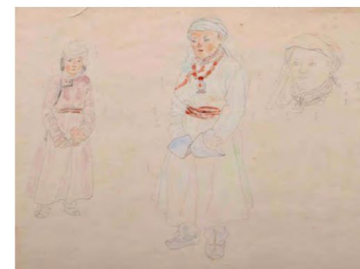
3. 赤羽末吉「内蒙古の青年」1943年 ちひろ美術館