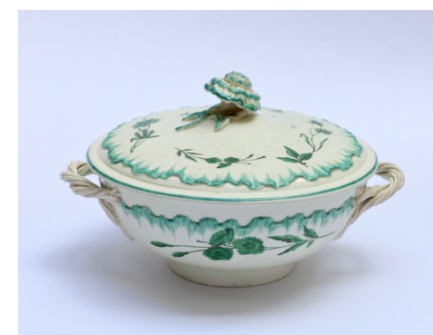
7 ウェッジウッド《蓋付き深皿(クイーンズウェア)》 1765-1770年 クリームウェア(陶器)、エナメル彩 個人蔵