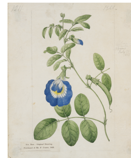
5 シデナム・ティースト・エドワーズ 《チョウマメ(マメ科)》 1813年 黒鉛、水彩、紙 キュー王立植物園