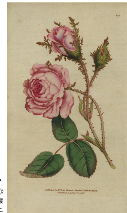
2▶ 《モスローズ(バラ科)》 1788年 銅版画、手彩色、紙 個人蔵