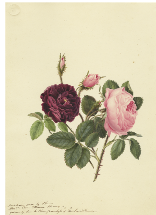
◀1 トマス・ハーヴェイ夫人 《ローザ・ケンティフォリア(キャベツローズ)とローザ・ガリカ(フレンチローズ)の栽培品種(バラ科)》 1800年 水彩、紙 キュー王立植物園