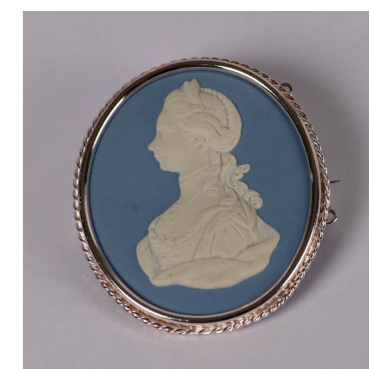
8 ウェッジウッド 《カメオ・ブローチ「シャーロット王妃」》 20世紀 ジャスパーウェア(炆器) 個人蔵