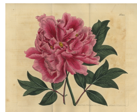
6 シデナム・ティースト・エドワーズ 《ポタンの栽培品種(ポタン科)》 1809年 銅版画、手彩色、紙 個人蔵