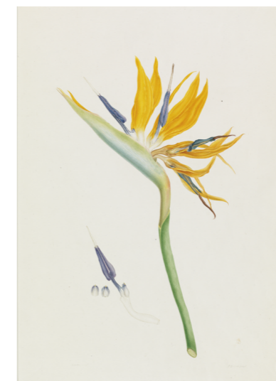
4 フランツ・アンドレアス・パウアー 《ゴクラクチョウカ(ストレリチア・レギネ) (ゴクラクチョウカ科)》1818年 石版画、手彩色、紙 キュー王立植物園