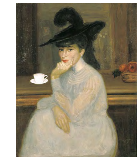
9 ジョルジュ・ポッティエニ 《バーで待つサラ・ベルナルの肖像》1907年 油彩/カンヴァス スイス プチ・パレ美術館 ASSOCIATION DES AMIS DU PETIT PALAIS, GENEVE