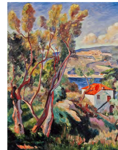
5 アンリ・マンギャン 《ヴィルフランシュの道》1913年 油彩/カンヴァス スイス プチ・パレ美術館 ASSOCIATION DES AMIS DU PETIT PALAIS, GENEVE