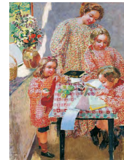
4 モーリス・ドニ 《休暇中の宿題》1906年 油彩/カンヴァス スイス プチ・パレ美術館 ASSOCIATION DES AMIS DU PETIT PALAIS, GENEVE