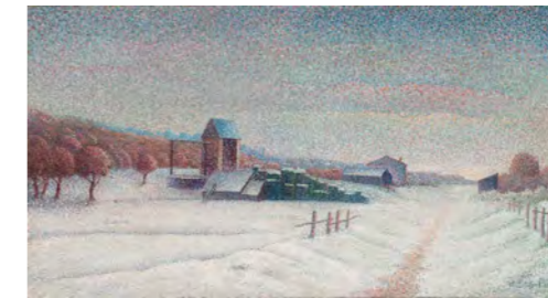
2 アルベール・デュボワ=ピエ 《冬の風景》1888-89年 油彩/カンヴァス スイス プチ・パレ美術館