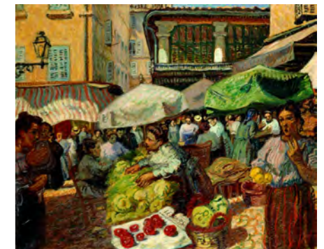
6 ラウル・デュフィ 《マルセイユの市場》1903年 油彩/カンヴァス スイス プチ・パレ美術館 ASSOCIATION DES AMIS DU PETIT PALAIS, GENEVE