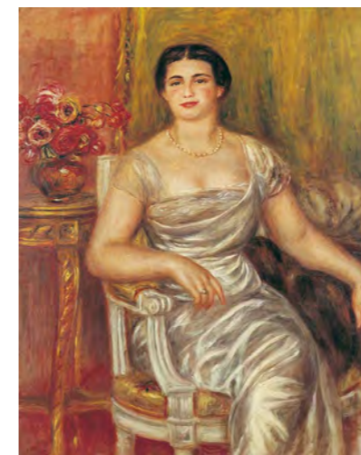
1 オーギュスト・ルノワール 《詩人アリス・ヴァリエール=メルツパッハの肖像》1913年 油彩/カンヴァス スイス プチ・パレ美術館 ASSOCIATION DES AMIS DU PETIT PALAIS, GENEVE