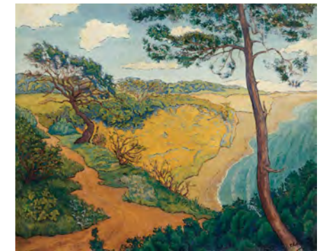
3 ポール=エリー・ランソン 《海辺の風景》1895年 油彩/カンヴァス スイス プチ・パレ美術館 ASSOCIATION DES AMIS DU PETIT PALAIS, GENEVE