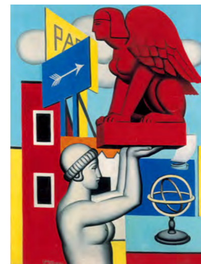
7 ジャン・メツァンジェ 《スフィンクス》1920年 油彩/カンヴァス スイス プチ・パレ美術館 ASSOCIATION DES AMIS DU PETIT PALAIS, GENEVE