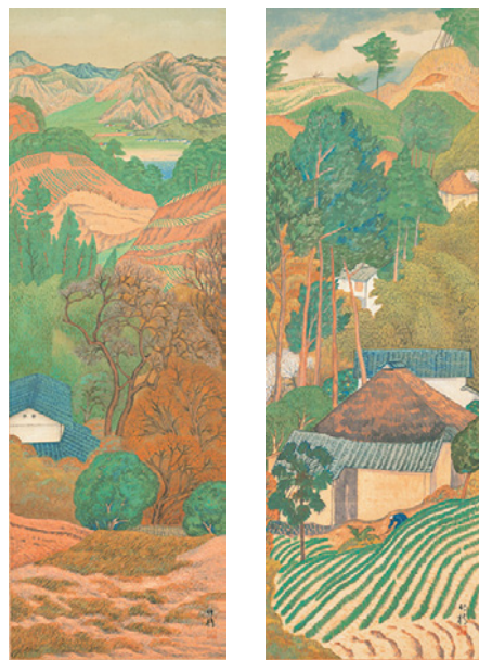
2、小野竹喬 《島二作 (早春・冬の丘)》1916年