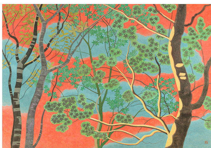
5、小野竹喬《樹間の茜》1974年