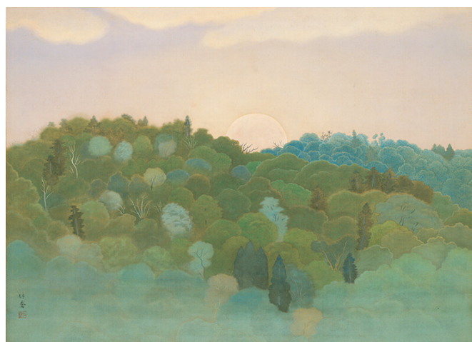
4、小野竹喬《仲秋の月》1947年