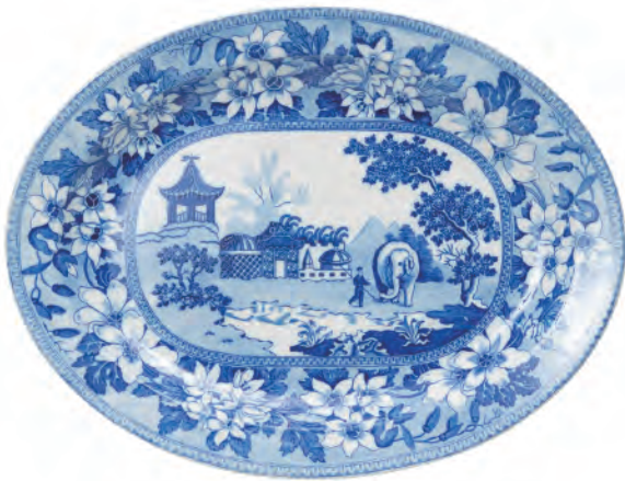
皿（アネモネ装飾 東洋庭園の象）/ 製作 1830 年代 / 陶器、転写装飾

ストックホルムから東へ約 20 km離れたヴァルムドゥー市に位置する港町グスタフスベリ。この地で製陶が始まったのは 1825 年のことでした。卸売業を営んでいたヘルマン・エーマンが製陶所の設立許可を得て、2 年後に工場が稼働を始めます。経営体制はその後幾度も変化しますが、グスタフスベリにおける製陶の礎がここで築られました。西欧では 18 世紀初頭にドイツのマイセンが硬質磁器の製造に成功し、グスタフスベリも当初はドイツから職人を呼びよせていました。しかし 19 世紀に入ってもなお磁器は高級品で、限られた人だけが手にできるものだったため、グスタフスベリではより安価で、民間が主導となって発展した英国の作陶を参考に、職人を招聘し、陶土やデザイン、銅板転写や鋳型成形などの技術を導入し量産体制を整えていきます。