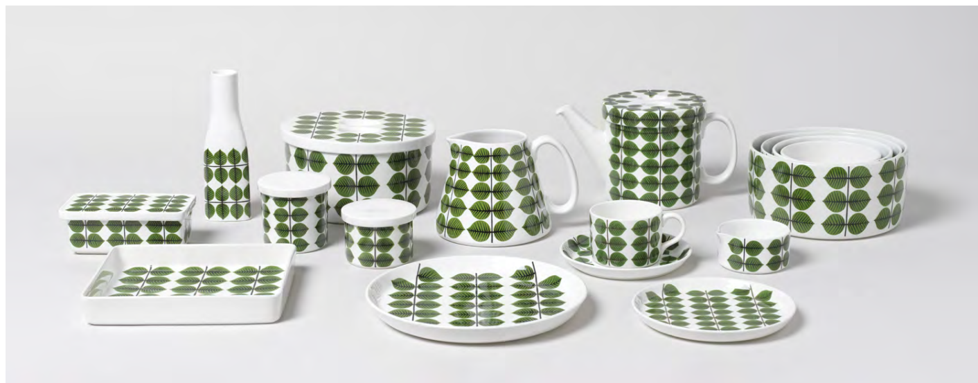
スティグ・リンドベリ「ベショー」シリーズ、LLモデル / 製作1960-1974年 / 陶器、転写装飾

かつての工場を再利用して建てられたグスタフスベリ陶磁美術館は、グスタフスベリの歴史と名作に触れることができる美術館です。2020年にスウェーデン国立美術館の管理のもと大幅なリニューアルを果たした同館のコレクションから約300点を紹介。現在では手に入りにくい貴重なプロダクトから、デザイナーたちが自由に制作活動することができた工房「G-スタジオ」で作られたユニーク・ピースと呼ばれる1点ものの作品まで、グスタフスベリの魅力が存分に伝わる作品たちが大集合します。