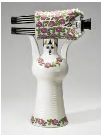
「サムヘルスデバッテン (社会討論)」 / 製作 1969-1971年 / 妬器、絵付・多色転写装飾