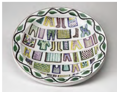
「トヴェットストレケット（洗濯物干し）」皿 / 1942 年 / ファイアンス、絵付装飾