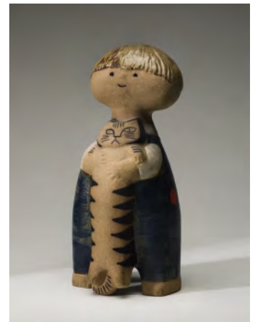
「ラーションの子どもたち」シリーズより ベッレ / 製作 1964-1980年 / 妬器