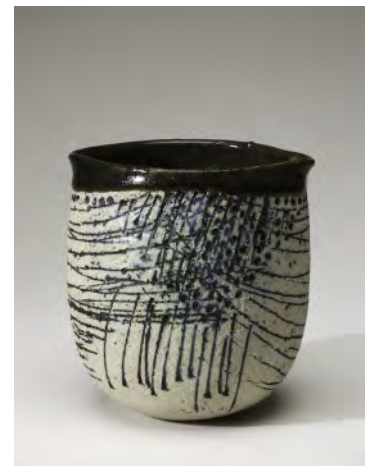
花器 / 1950-1960年代 / 妬器、ろくろ成形、エッチング装飾