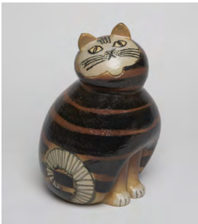
「大きな動物園」シリーズより猫 / 製作 1966-1992年 / 妬器

本パートでは、グスタフスベリ在籍中に手がけたテーブルウェア、日本でも人気の高い猫やライオンのフィギュリンたち、レリーフや彫像作品などの1点ものの作品まで、多彩な魅力にあふれるラーソンを紹介します。