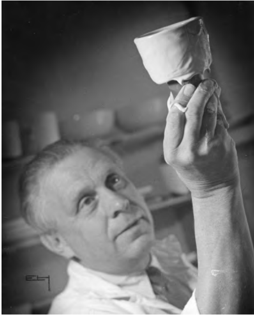
施釉するコーゲ／1950年代頃

1917年、スウェーデン・スライド協会の推薦により、画家・グラフィックデザイナーのヴィルヘルム・コーゲがグスタフスベリに入社します。コーゲはアーティストック・ディレクターとして、一般家庭でも使いやすいデザインと価格が両立するテーブルウェアを生み出し、グスタフスベリを国民的ブランドへと押し上げました。