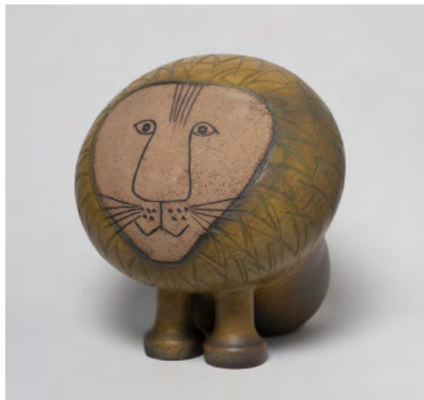
「アフリカ」シリーズより ジャイアント・ライオン / デザイン 1964年 / 製作 1964-1988年 / 施釉妬器、絵付装飾