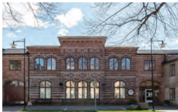
グスタフスベリ陶磁美術館、グスタフスベリ

スウェーデン国立美術館は、1866 年ストックホルムに開館しました。王室が築き上げたコレクションが基礎となり、1500 年から 1900 年までの絵画、彫刻、素描、版画、および中世初期から現在までの工芸、デザイン、肖像画で構成されています。ヨーロッパの画家たちによる傑作に加え、カール・ラーションやアンデシュ・ゾーンといったスウェーデンの芸術家による重要な作品が含まれています。