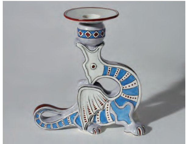
「ノーディスク・スティール」燭台 / 製作 1870-1880 年代 / 陶器、絵付装飾

創業当初は国外からの影響を強く受けていたグスタフスベリですが、1870 年代頃から独自の製品作りが進められていきます。英国のアーツ・アンド・クラフツ運動や、世界を席卷していたアール・ヌーヴォー様式が、工業化・都市化が進む北欧にももたらされると、自国の歴史や文化を見直すナショナル・ロマンティズムの機運が高まります。民族的アイデンティティであるヴァイキング文化からモチーフを引用したり、スウェーデンに自生する身近な植物が描かれるなど、国際的なトレンドとスウェーデンらしさが融合する製品が作られていきます。さらに 1889 年のパリ万博をはじめ、国内外の展覧会へと出品を重ねることで、グスタフスベリは技術や独自性を磨き、ブランドとしての地位を確立していきました。