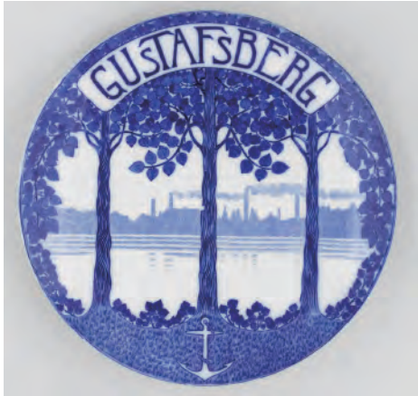
グスタフスベリのプロモーションプレート（工場の風景）/1911年 / 磁器、転写装飾

ストックホルムから東へ約 20 km離れたヴァルムドゥー市に位置する港町グスタフスベリ。この地で製陶が始まったのは 1825 年のことでした。卸売業を営んでいたヘルマン・エーマンが製陶所の設立許可を得て、2 年後に工場が稼働を始めます。経営体制はその後幾度も変化しますが、グスタフスベリにおける製陶の礎がここで築られました。西欧では 18 世紀初頭にドイツのマイセンが硬質磁器の製造に成功し、グスタフスベリも当初はドイツから職人を呼びよせていました。しかし 19 世紀に入ってもなお磁器は高級品で、限られた人だけが手にできるものだったため、グスタフスベリではより安価で、民間が主導となって発展した英国の作陶を参考に、職人を招聘し、陶土やデザイン、銅板転写や鋳型成形などの技術を導入し量産体制を整えていきます。