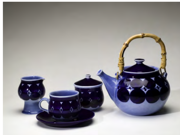
「マティルダ」シリーズ / デザイン 1960年代 / 製作 1962-1972年 / 陶器、絵付装飾