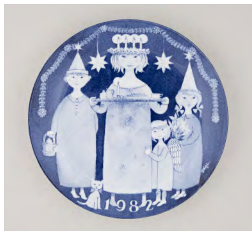
クリスマスコレクションプレート（1982、ルシーアの行列と共に） / 1982 年 / 浮彫・絵付装飾

毎年 12 月 13 日に行われる スウェーデンの伝統行事ルシア祭。 蠟燭の冠をつけた聖人ルシーアに扮した 子どもたちが行進します。 黄金色のサフランパンも欠かせません。