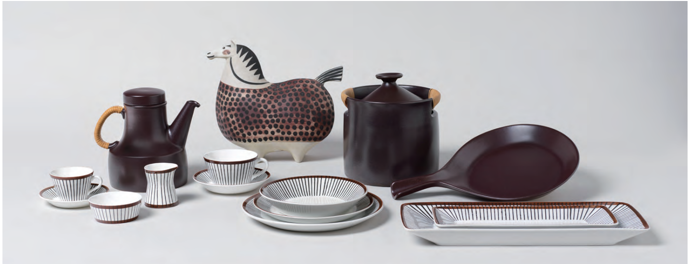
スティグ・リンドベリ「スピーサー・リップ」/ 製作 1955-1974 年 / ボーンチャイナ、転写・転写装飾 「スプリングレ (馬)」/ 製作 1950-1970 年代 / 炆器、絵付装飾 「テルマ」/ 製作 1955-1979 年 / 耐火樹脂、耐火陶器ほか

スウェーデンの首都ストックホルムから東へ約 20 km離れたヴァルムドゥー市に位置する港町グスタフスベリ。この地に製陶所が設立されたのは 1825 年のことでした。デザイナーの自由な創造と産業が結びついた豊かな関係から生み出されたテーブルウェアの数々は、人々の日常に寄り添い、暮らしを彩ってきました。本展はグスタフスベリを代表する 4 人のデザイナー、ヴィルヘルム・コーゲ、スティグ・リンドベリ、リサ・ラーソン、カーリン・ビョルクヴィストに焦点をあて、スウェーデン国立美術館が所蔵する約 300 点の作品で、今なお愛されるグスタフスベリの歴史と魅力をひもとく、日本初の展覧会です。