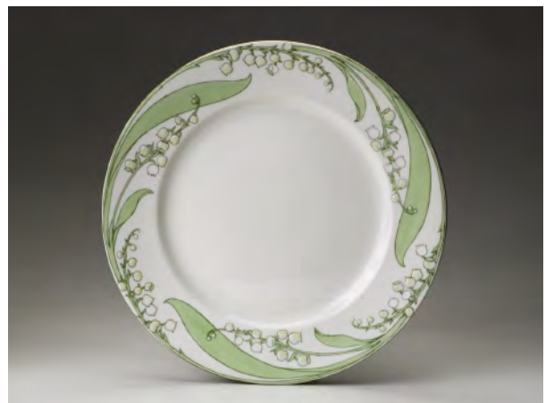
「リリエコンヴァリイ（スズラン）」皿、W モデル / デザイン 1897 年以前 / 陶器、転写装飾、エナメル彩

世界的に流行したアール・ヌーヴォー様式と スウェーデンでクリスマスの花として親しまれている スズラン模様が融合！