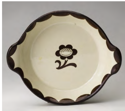
「ビューロ」耐熱深皿 / 製作1930-1955年、転写・絵付装飾