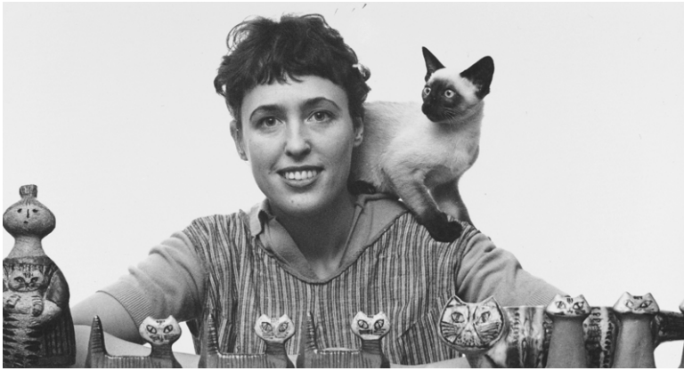
リサと猫たち / 1950年代

リンドベリの招きにより、1954年にG-スタジオの実習生としてグスタフスベリへ入ったリサ・ラーソンは、機能的でシンプルさを重んじるモダニズム全盛の北欧デザインに、温かみとユーモアをもたらします。産業デザインには関心が薄く、作家志望のラーソンを尊重し、アトリエや専属のろくろ師が数名つくなど、制作に専念する環境が整えられました。