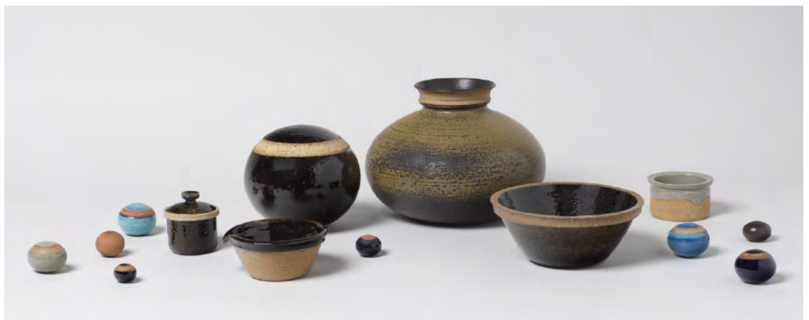
花器 / 1950 年代 / 妬器 ボウル / 製作 1950 年代 / 妬器、浮彫装飾 蓋付ポット / 約 1950 年代 / 妬器 球体 / デザイン 1950-1960 年代 / 妬器、手ろくろ成形、施釉