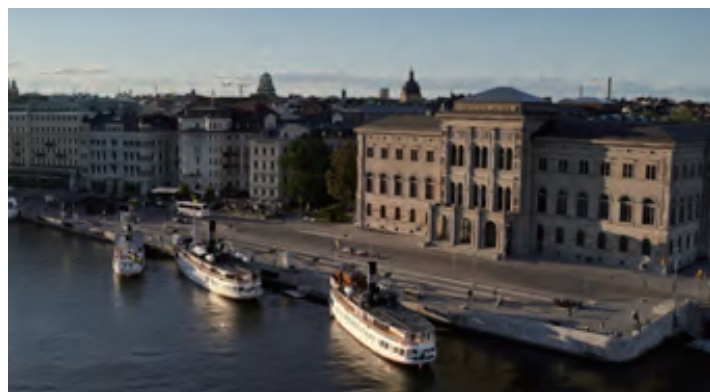
スウェーデン国立美術館、ストックホルム