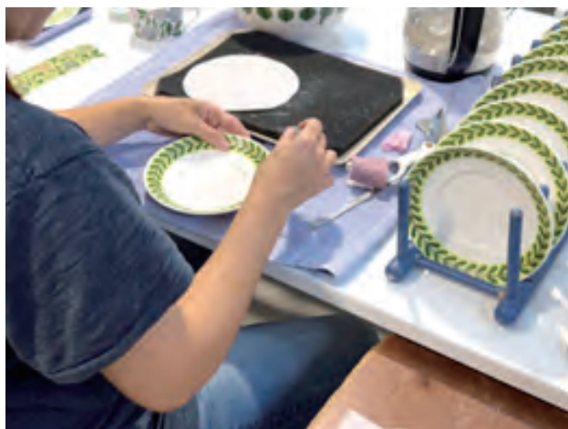
グスタフスベリの現在の製造ライン

食卓を彩るテーブルウェアに留まらず、トイレや洗面器などの衛生陶器も製造し、まさにスウェーデンの暮らしに欠かせない存在であったグスタフスベリは、2025 年に創業から 200 年が経ちました。現在では技術を受け継いだ職人たちによって、一部の復刻版がグスタフスベリの街で作られています。日本でも人気が高い、北欧を代表するブランド／メーカーはいくつも存在しますが、経営の生き残りをかけて吸収合併を繰り返し、工場の拠点を国外へと切り替えたところもあるなか、製陶所の歴史を受け継いでいるグスタフスベリは、北欧のなかでも貴重な場所と言えるでしょう。かつての工場を再利用して建てられたグスタフスベリ陶磁美術館は、グスタフスベリの歴史と名作に触れることができる施設で、2020 年にスウェーデン国立美術館の管理のもと大幅なリニューアルを果たしました。その他現在使われなくなったスペースはアーティスト・イン・レジデンス施設として活用され、陶磁器に限らず様々なアーティストたちが制作を行っています。かつての生産量に比べると規模は縮小しましたが、現在もグスタフスベリの街全体がものづくりの歴史と精神を受け継いでいます。