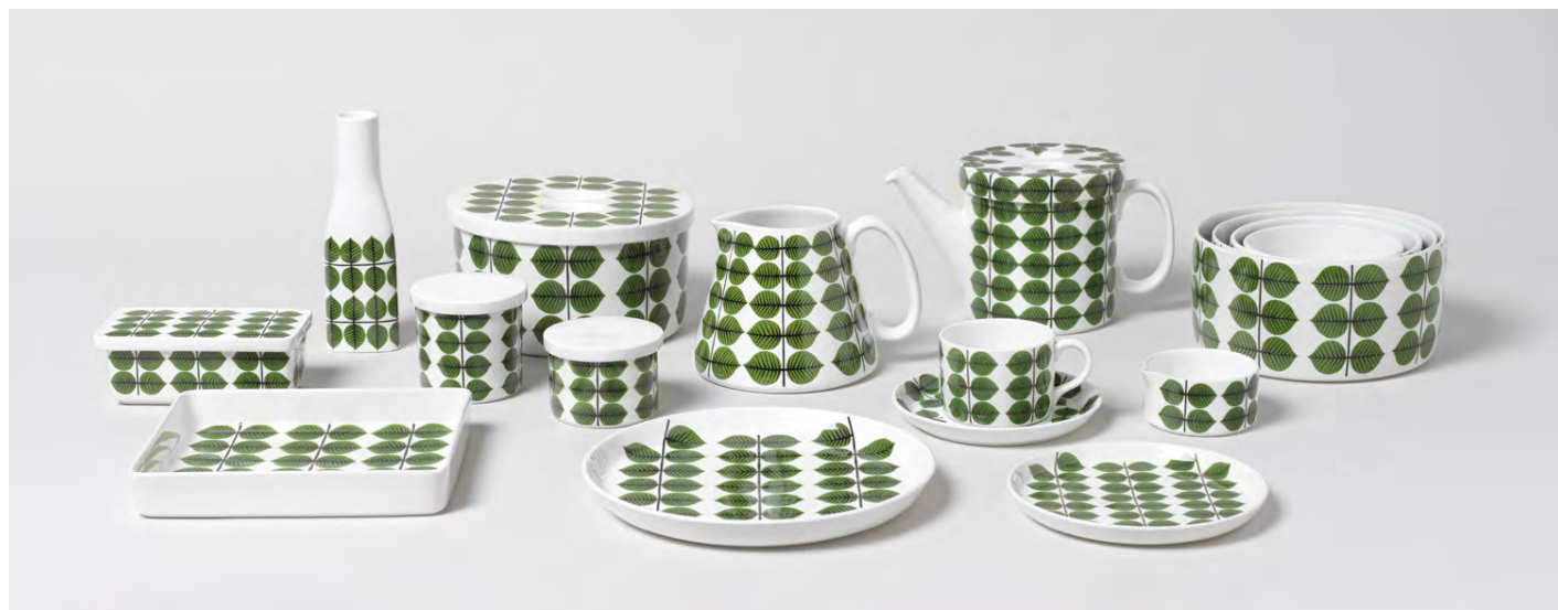
スティグ・リンドベリ「ベショー」シリーズ、LLモデル / 製作1960-1974年 / 陶器、転写装飾

かつての工場を再利用したグスタフスベリ陶磁美術館は、グスタフスベリの歴史と名作に触れることができる美術館です。2020年にスウェーデン国立美術館の管理のもと大幅なリニューアルを果たした同館のコレクションから約300点を紹介。現在では手に入りにくい貴重なプロダクトから、デザイナーたちが自由に制作活動をする事ができた工房「G-スタジオ」で作られたユニーク・ピースと呼ばれる1点ものの作品まで、グスタフスベリの魅力が存分に伝わる作品たちが大集合します。