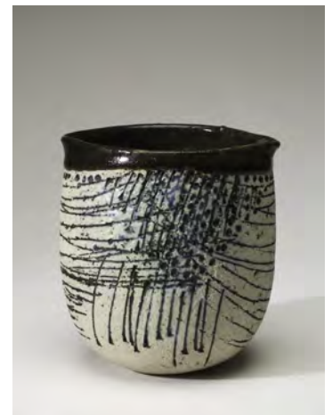
花器 / 1950-1960年代 / 妬器、ろくろ成形、エッチング装飾