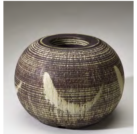
「ファシュタ」花器 / 約 1950年代 / 炆器、搔落し装飾