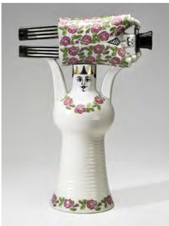
「サムヘルスデバッテン（社会討論）」 / 製作1969-1971年 / 妬器、絵付・多色転写装飾