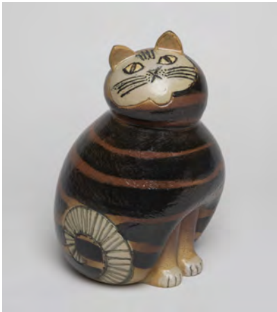
「ストーラ・ソー（大きな動物園）」シリーズよりネコ / 製作1966-1992年 / 妬器

本パートでは、グスタフスベリ在籍中に手がけたテーブルウェア、日本でも人気の高いネコやライオンのフィギュリンたち、レリーフや彫像作品などの1点ものの作品まで、多彩な魅力にあふれるラーソンを紹介します。