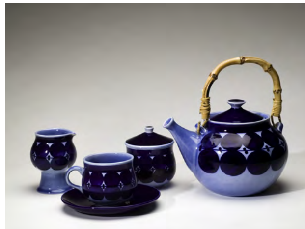
「マティルダ」シリーズ / デザイン1960年代 / 製作1962-1972年 / 陶器、絵付装飾