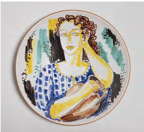
皿 / 1942年 / ファイアンス、絵付装飾