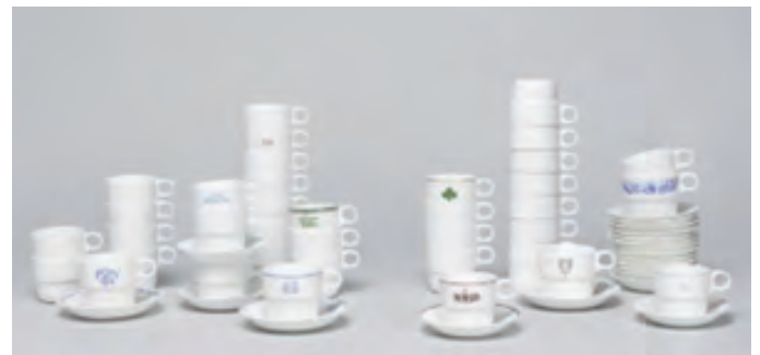
コーヒーカップ＆ソーサー、BLモデル（一部出品） / 製作1974年以降 / ボーンチャイナ