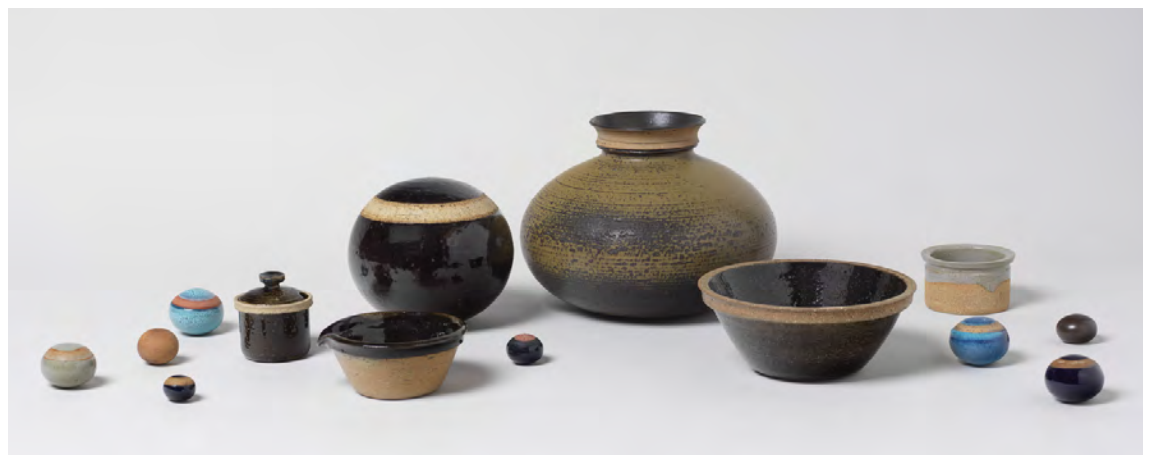
花器 / 1950年代 / 妬器 ボウル / 製作1950年代 / 妬器、浮彫装飾 蓋付ポット / 約1950年代 / 妬器 球体 / デザイン1950-1960年代 / 妬器、手ろくろ成形、施釉