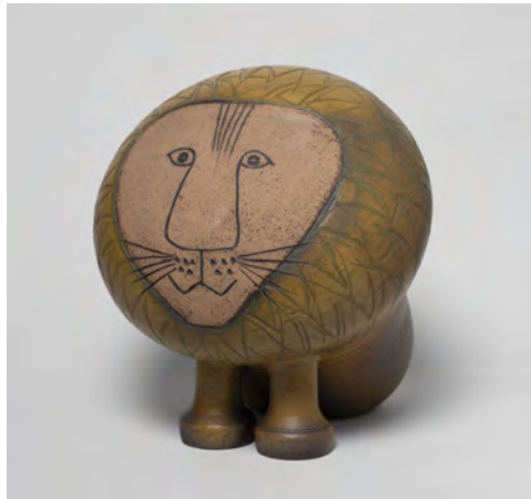
「アフリカ」シリーズより ジャイアント・ライオン / デザイン 1964年 / 製作1964-1988年 / 施釉妬器、絵付装飾