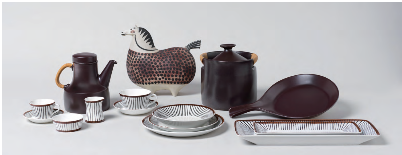
スティグ・リンドベリ「スピーサー・リップ」/ 製作 1955-1974 年 / ボーンチャイナ、転写・転写装飾 「スプリングレ (馬)」/ 製作 1950-1970 年代 / 炆器、絵付装飾 「テルマ」/ 製作 1955-1979 年 / 耐火樹脂、耐火陶器ほか

スウェーデンの首都ストックホルムから東へ約 20 km離れたヴァルムドゥー市に位置する港町グスタフスベリ。この地に製陶所が設立されたのは 1825 年のことでした。デザイナーの自由な創造と産業が結びついた豊かな関係から生み出されたテーブルウェアの数々は、人々の日常に寄り添い、暮らしを彩ってきました。本展はグスタフスベリを代表する 4 人のデザイナー、ヴィルヘルム・コーゲ、スティグ・リンドベリ、リサ・ラーソン、カーリン・ビョルクヴィストに焦点をあて、スウェーデン国立美術館が所蔵する約 300 点の作品で、今なお愛されるグスタフスベリの歴史と魅力をひもとく、日本初の展覧会です。