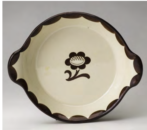
「ビューロ」耐熱深皿 / 製作 1930-1955年、転写・絵付装飾