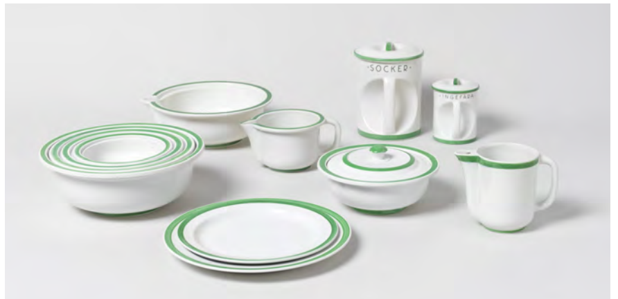
「ウィークエンド」シリーズ、「プラクティカ」モデル / 1930年代 / 陶器、絵付装飾