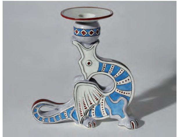
「ノーディスク・スティール」燭台 / 製作 1870-1880 年代 / 陶器、絵付装飾

創業当初は国外からの影響を強く受けていたグスタフスベリですが、1870 年代頃から独自の製品作りが進められていきます。英国のアーツ・アンド・クラフツ運動や、世界を席巻していたアール・ヌーヴォー様式が、工業化・都市化が進む北欧にももたらされると、自国の歴史や文化を見直すナショナル・ロマンティズムの機運が高まります。民族的アイデンティティであるヴァイキング文化からモチーフを引用したり、スウェーデンに自生する身近な植物が描かれるなど、国際的なトレンドとスウェーデンらしさが融合する製品が作られていきます。さらに 1889 年のパリ万博をはじめ、国内外の展覧会へと出品を重ねることで、グスタフスベリは技術や独自性を磨き、ブランドとしての地位を確立していきました。