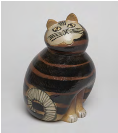
「ストーラ・ソー（大きな動物園）」よりネコ / 製作 1966-1992年 / 珐瑯