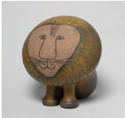
「アフリカ」より ジャイアント・ライオン / デザイン 1964年 / 製作 1964-1988年 / 施釉珐瑯、絵付装飾