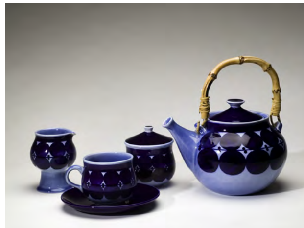
「マティルダ」 / デザイン 1960年代 / 製作 1962-1972年 / 陶器、絵付装飾