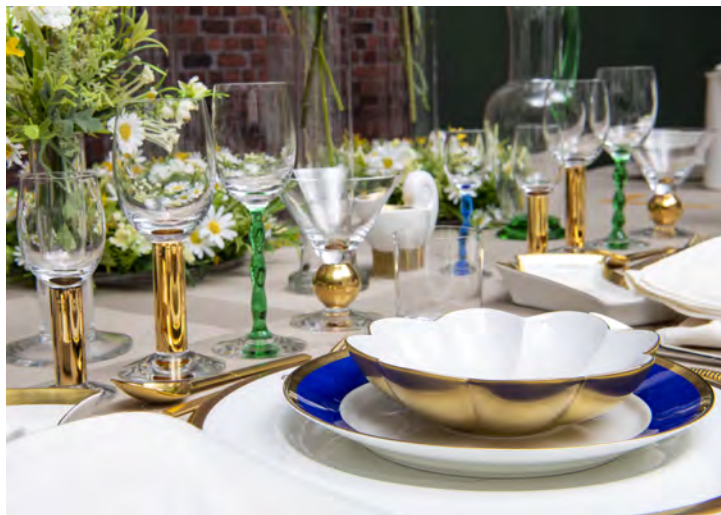
製造ロールストランド・グスタフスベリ / 「ノーベル・サービス」(参考写真) / 製作 1991 年 / ボーンチャイナ、金彩