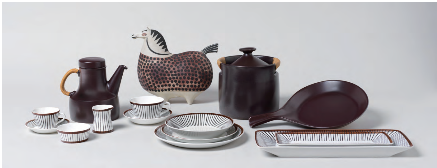
スティグ・リンドベリ「スピーサ・リップ」/ 製作 1955-1974 年 / ボーンチャイナ、転写・転写装飾 「スプリングレ (馬)」/ 製作 1950-1970 年代 / 炆器、絵付装飾 「テルマ」/ 製作 1955-1979 年 / 耐火樹脂、耐火陶器ほか

スウェーデンの首都ストックホルムから東へ約 20 km離れたヴァルムドゥー市に位置する港町グスタフスベリ。この地に製陶所が設立されたのは 1825 年のことでした。デザイナーの自由な創造と産業が結びついた豊かな関係から生み出されたテーブルウェアの数々は、人々の日常に寄り添い、暮らしを彩ってきました。本展はグスタフスベリを代表する 4 人のデザイナー、ヴィルヘルム・コーゲ、スティグ・リンドベリ、リサ・ラーソン、カーリン・ビョルクヴィストに焦点をあて、スウェーデン国立美術館が所蔵する約 300 点の作品で、今なお愛されるグスタフスベリの歴史と魅力をひもとく、日本初の展覧会です。