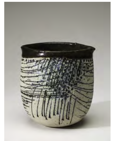
花器 / 1950-1960年代 / 珐瑯、ろくろ成形、エッチング装飾