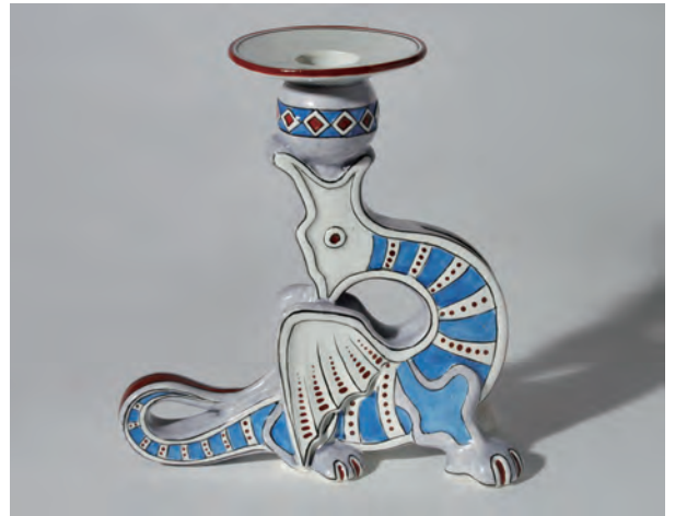
「ノーディスク・スティール」燭台 / 製作 1870-1880 年代 / 陶器、絵付装飾

創業当初は国外からの影響を強く受けていたグスタフスベリですが、1870 年代頃から独自の製品作りが進められていきます。英国のアーツ・アンド・クラフツ運動や、世界を席卷していたアール・ヌーヴォー様式が、工業化・都市化が進む北欧にももたらされると、自国の歴史や文化を見直すナショナル・ロマンティズムの機運が高まります。民族的アイデンティティであるヴァイキング文化からモチーフを引用したり、スウェーデンに自生する身近な植物が描かれるなど、国際的なトレンドとスウェーデンらしさが融合する製品が作られていきます。さらに 1889 年のパリ万博をはじめ、国内外の展覧会へと出品を重ねることで、グスタフスベリは技術や独自性を磨き、ブランドとしての地位を確立していきました。