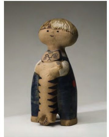
「ラーソンス・ウンガル（ラーソンの子どもたち）」より ベッレ / 製作 1964-1980年 / 珐瑯