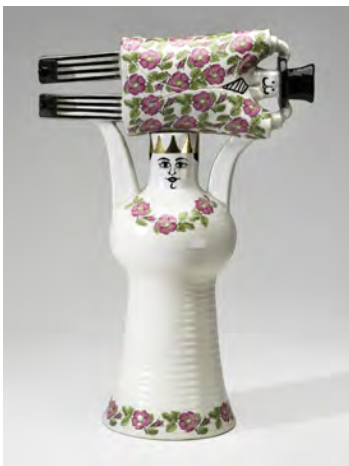
「サムヘルスデバッテン（社会討論）」 / 製作 1969-1971年 / 珐瑯、絵付・多色転写装飾