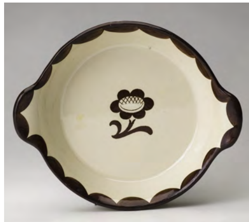
「ビューロ」耐熱深皿 / 製作 1930-1955年、転写・絵付装飾