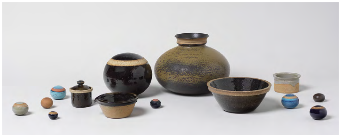
花器 / 1950 年代 / 妬器 ボウル / 製作 1950 年代 / 妬器、浮彫装飾 蓋付ポット / 約 1950 年代 / 妬器 球体 / デザイン 1950-1960 年代 / 妬器、手ろくろ成形、施釉