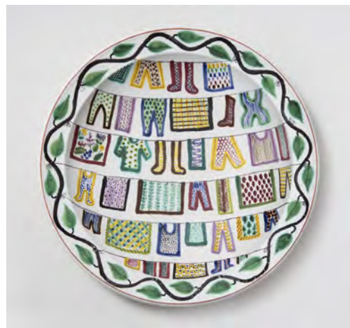
「トヴェットストレケット (洗濯物干し)」皿 / 1942年 / ファイアンス、絵付装飾