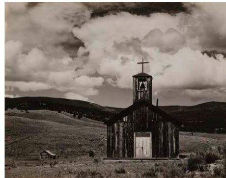
エドワード・ウェストン(E)タウン、ニュー・メキシコ)1933 ゼラチン・シルバー・プリント 京都国立近代美術館