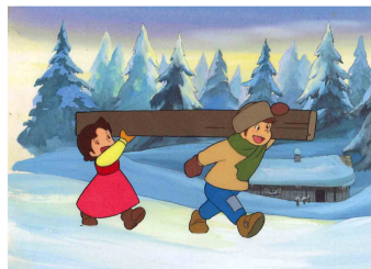
「アルプスの少女ハイジ」(1974年)より © ZUIYO