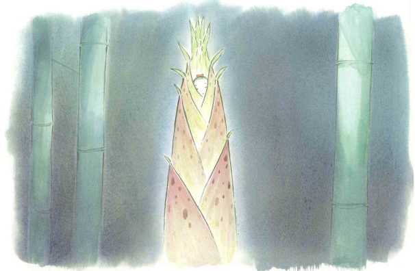
「かぐや姫の物語」(2013年)より