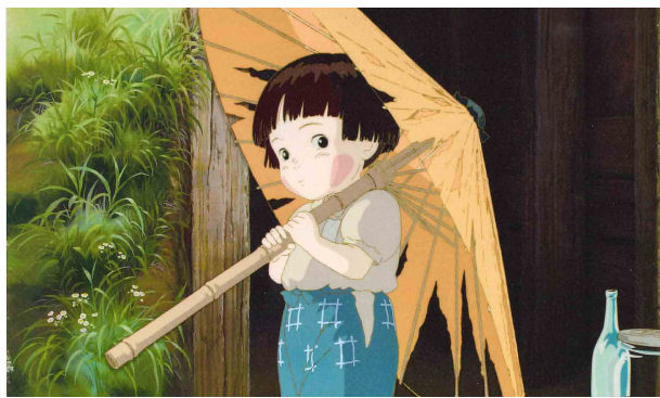
「火垂るの墓」(1988年)より

高畑勲監督は、小学校6年生の国語の教科書(光村図書)に掲載されている「『鳥獣戯画』を読む」の筆者としても知られています。本展ではその元となった著書『十二世紀のアニメーションー国宝絵巻物に見る映画的・アニメ的なもの』(徳間書店、1999年)の紹介や、絵巻物研究の成果が発揮された『ホーホケキョ とんりの山田くん』『かぐや姫の物語』にまつわる着彩ボードや作画、背景画、映像などを多数展示します。