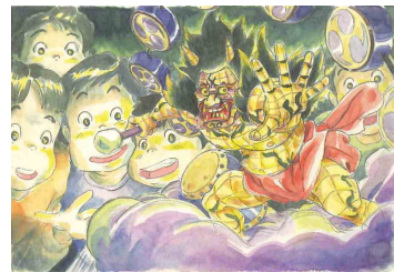
「平成狸合戦ぽんぽこ」(1994年)より